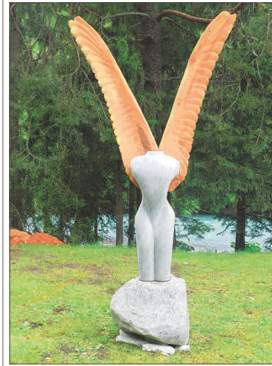
Ün exaimpel d'ina sculptura ch'i'd es gnida creada l'En e la via chi maina vers il cumünin da Sur En.