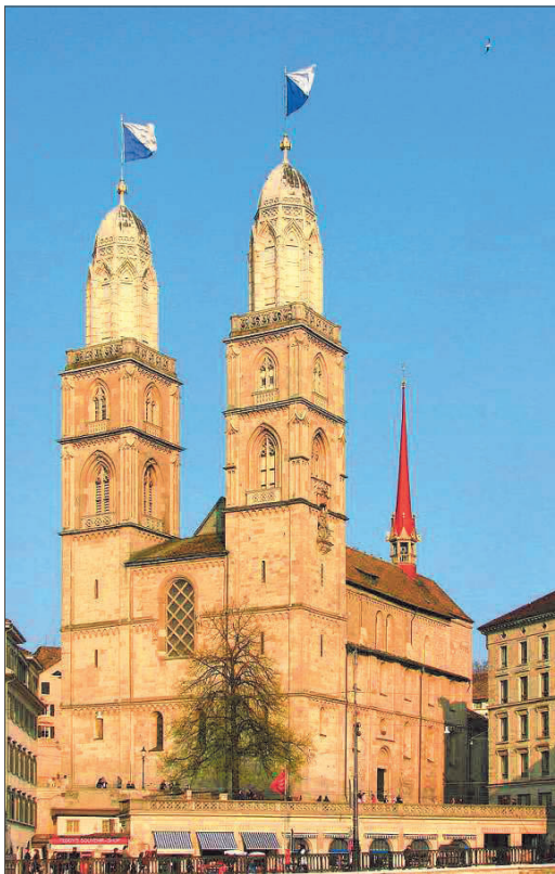
En ed enturn il «Grossmünster» a Turitg han lieu differentas commemoraziuns en connex cun il giubileum da 500 onns Reformaziun.

Acceptar il pluralissem d'opiniun Kässmann sutstratiga che la reformaziun haja mess d'acceptar il pluralissem: «Ins fa endament la reformaziun en sia dimensiun europeica (...). Nus dialogain cun ils gidieus ed emprendain a dialogar cun ils muslims (...). Nus avain chapì ch'i dat per autra giueud in'autra vardad ed in auter access a Dieu. Nus avain (...) emprendi d'acceptar che l'auter uman è different (...). Per l'emprima giada commemorar nus la reformaziun guardond sin nossas atgnas culpas (...).