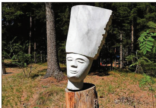
120 ouvras imbellischan la Senda da sculpturas a Sur En.

Ulteriuras infoormaziuns as chatta sülla pagina d'internet www.art-engiadina.com