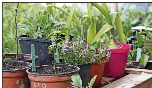
Cultivar semenza ei iu empau en emblidanza, il hortulan da hobi cumpara plantinas.