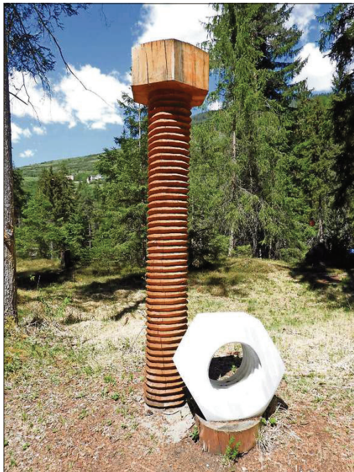
Eir ingon han ils partecpantes la pussibilità da cumbinar lain e cun marmel da Laas.

Ils respunsabels dal Simposi internaziunal da sculpturas mettan a disposiziun a las ar-