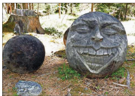
Eir ouvras da lain sun expostas lung la Senda da sculpturas.