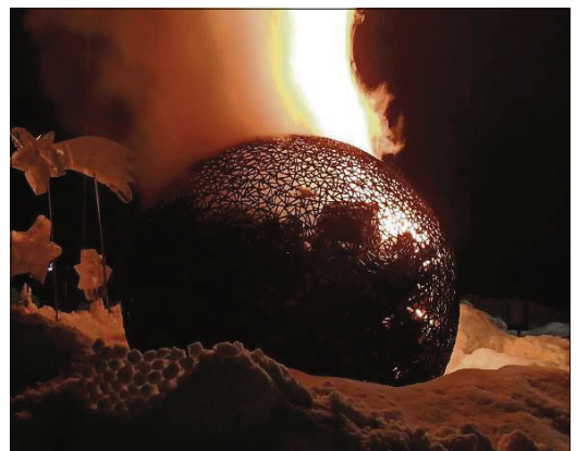
La culla da fö ha signalisà la fin dal chastè da glatsch.