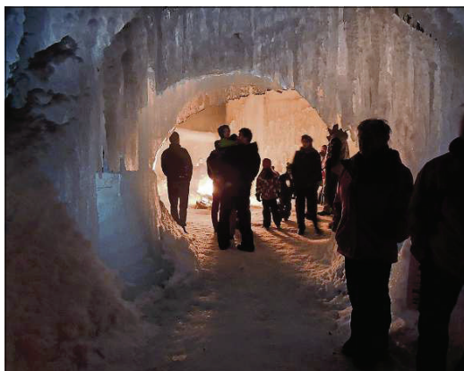
L'entrada dal chastè.