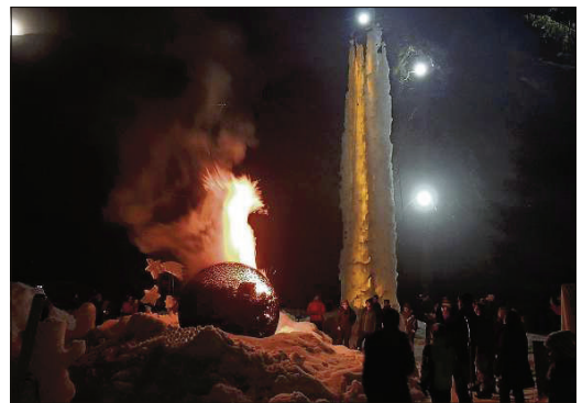
La culla da fö dasper il clucher per rampignar.

evenimaints per spordscher a giasts ed indigens la pussibilità da passantar ün pèruras in ün ambiat particular. «Il chastè da glatsch cha no vain pudü giodair quist inviern es stat ün evenimaint fich special ed ha sport a tuots üna pussibilità unica da pudair tratgnair in ün ambiat da fö e da glatsch. Eir la piazza da glatsch e la tuor per rampignar qua a Sur En vegnan dovradas diligaintamaing e fuorman insembel üna sporta spectaculara.» Cun la festa «fö i'l glatsch» han tut cumgià var 150 persunas in dumengia dal chastè da glatsch chi ha pesserà i'ls ultims duos mais per bels evenimaints. A la fin da la festa es gnüda impizzada üna culla immez l'iert da glatsch. Quai ha dat a la festa da cumgià il titel da la sairada «fö i'l glatsch». Ils respunsabels, a lur testa Bosshardt, pon s'allegrar d'una acziun gratiada.